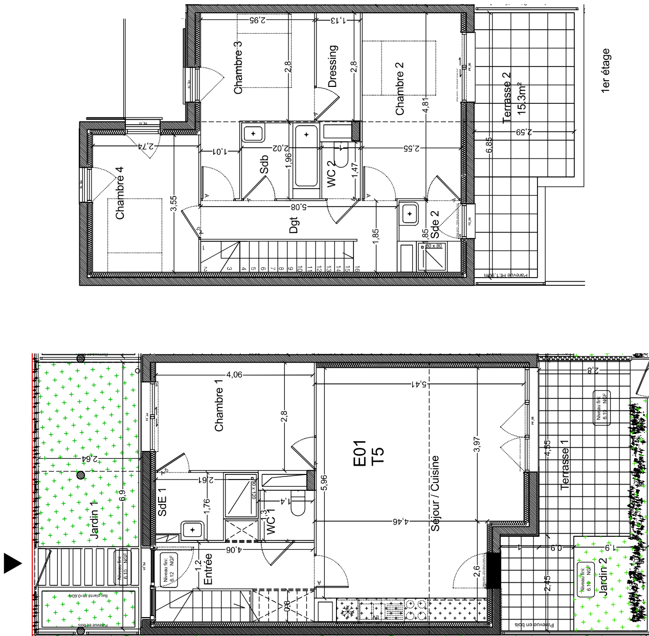
Rez de chaussée