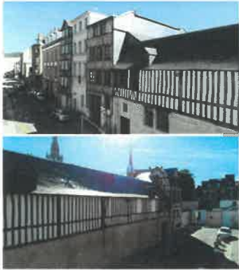
Vues extérieures depuis séjour