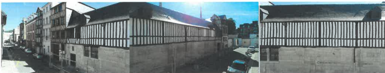
Vues extérieures depuis séjour