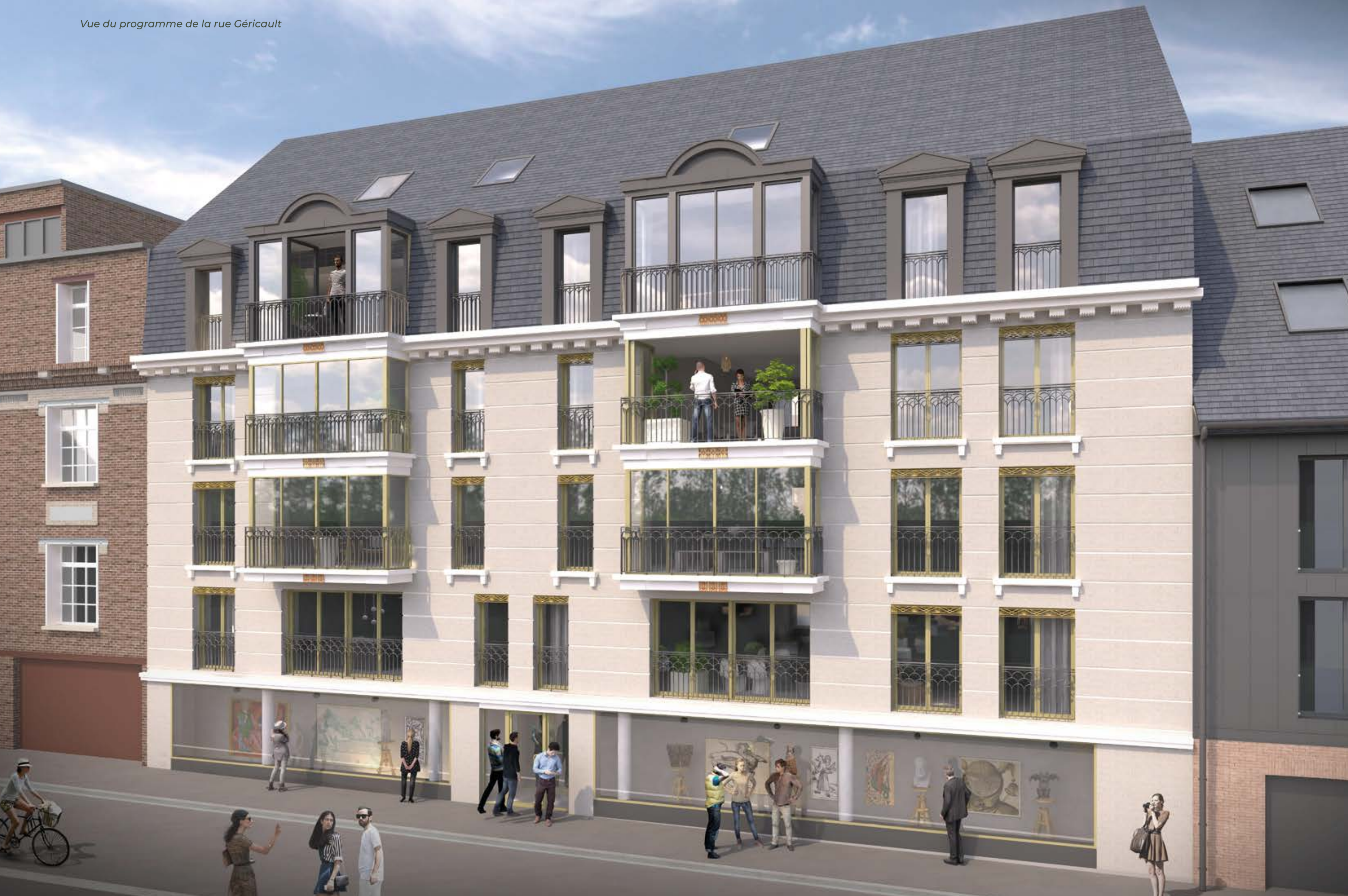
Vue du programme de la rue Géricault